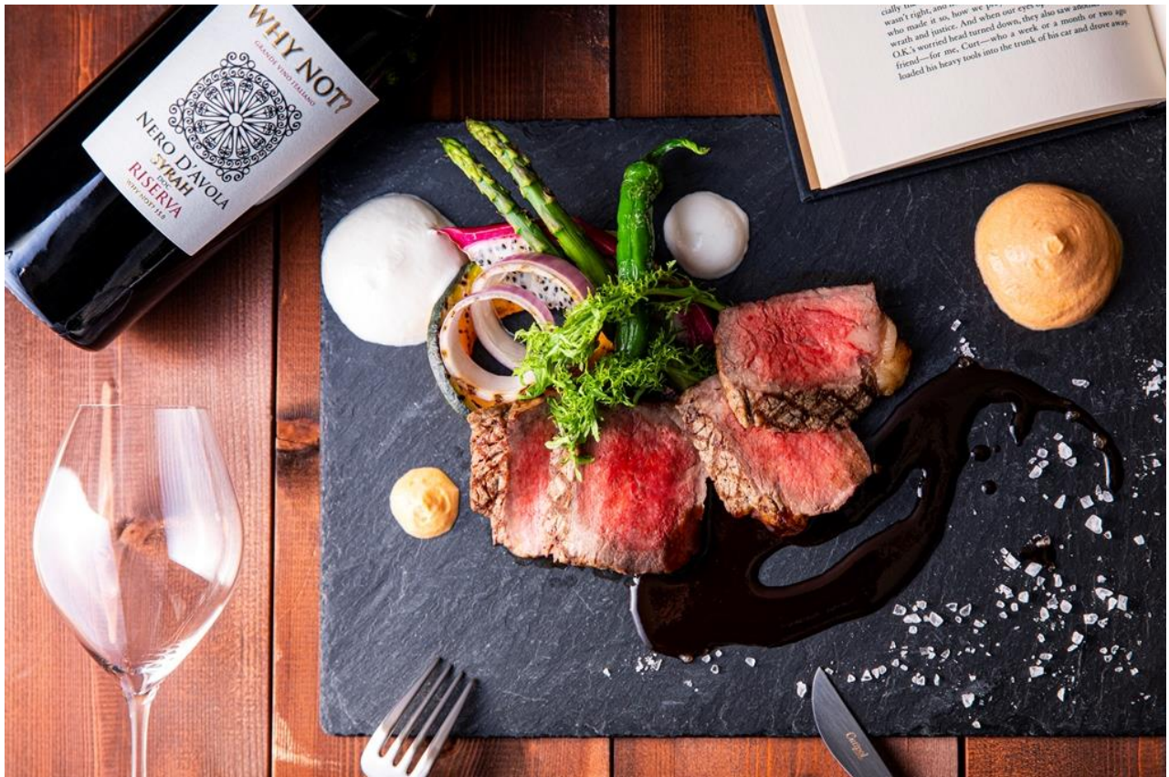
THE BASICS FUKUOKA ディナーブッフェ提供お料理 イメージ

上質なお料理をカジュアルにお楽しみいただけるブッフェスタイルのオールデイダイニングです