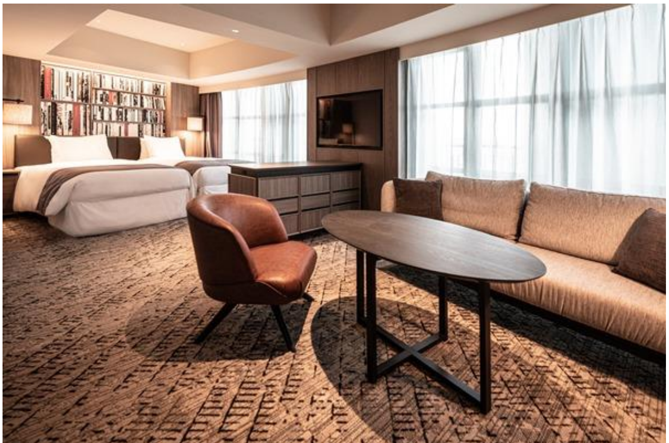
THE BASICS FUKUOKA 客室イメージ