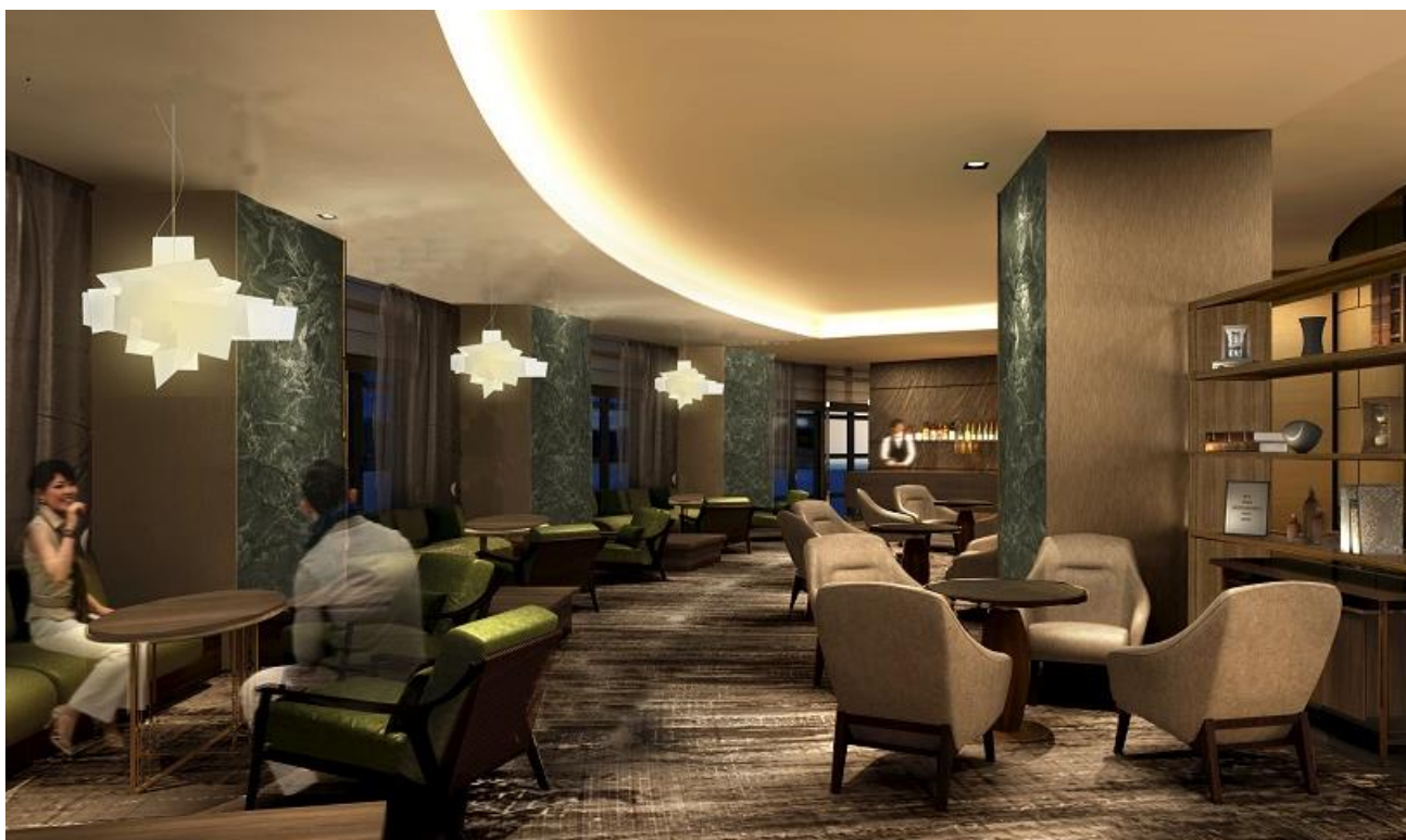
THE BASICS FUKUOKA ラウンジ イメージ

1階フロントロビーには「Episode」または「Story」にご宿泊の方々のみがお利用いただける専用ラウンジを設けました。落ち着いたインテリアの中、大阪で絶大な人気を誇るタカムラコーヒーローズスターズ（大阪市西区）より取り寄せた豆を使うコーヒーや、ビール・ワイン等アルコール類をフリーフローでお愉しみいただけます。